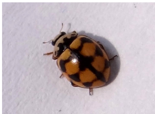
Untypically coloured Coccinula quatuordecimpustulata from wet meadow near the bog Moczydło