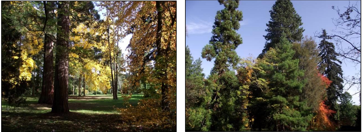
Vues des différentes collections de l'arboretum

Leconte (1999) sur les odonates et celui d'Archaux (2009) sur les lépidoptères rhopalocères. Ces trois auteurs ont d'ailleurs collecté bon nombre de données sur d'autres groupes, respectivement depuis 1997 et 2004.