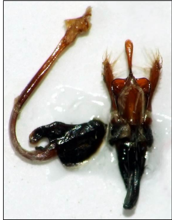
Genitalia de Coccinella magnifica

Coccinella magnifica est une espèce largement répartie dans la région paléarctique (Iablokoff-Khznorian, 1982), présente probablement dans toute la France (Dauguet, 1949 ; Tronquet, 2014) à proximité des fourmilières du genre Formica . Elle est cependant toujours citée comme rare, peu fréquente ou sporadique, peut-être sous-estimée du fait de sa ressemblance avec la banale Coccinella septempunctata L.