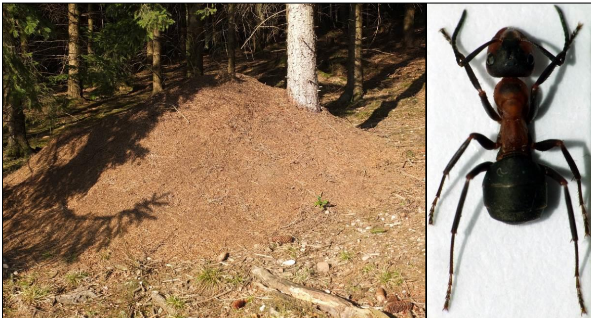
Vue du biotope de collecte : fourmilière de Formica polyctena en lisière de plantation d'épicéa, et vue d'une ouvrière

Les quatre taches ventrales blanches permettent une pré-identification à vue facile sur le terrain ; attention toutefois aux taches postérieures qui peuvent être réduites. L'un des mâles prélevés présente ainsi des métépimères noirs et juste une étroite bande blanche au sommet des métépisternes. Le prélèvement de quelques individus permet de vérifier les autres critères sous la loupe (forme des angles antérieurs du pronotum, gouttière élytrale, profil des élytres, génitalia du mâle, etc.) et de s'affranchir ainsi de toute confusion avec Coccinella septempunctata .