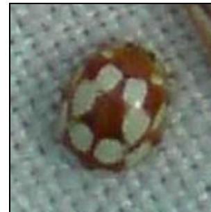
Vibidia duodecimguttata ♀ capturée à Vitrolles-en-Luberon le 3 mars 2015