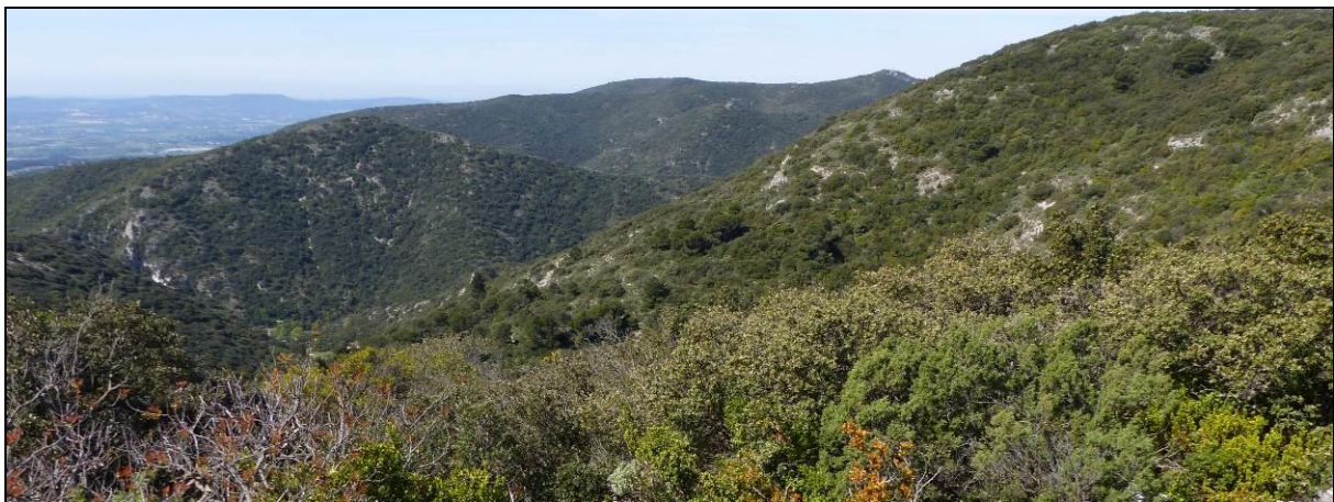
Aperçu du Grand Luberon

Il s'agit d'une femelle capturée le 03-III-2015 au battage d'un Genévrier ( Juniperus sp. ), au nord du Vallon des Agasses, sur la commune de Vitrolles-en-Luberon (Vaucluse), à environ 695 mètres d'altitude, dans le secteur du Grand Luberon.