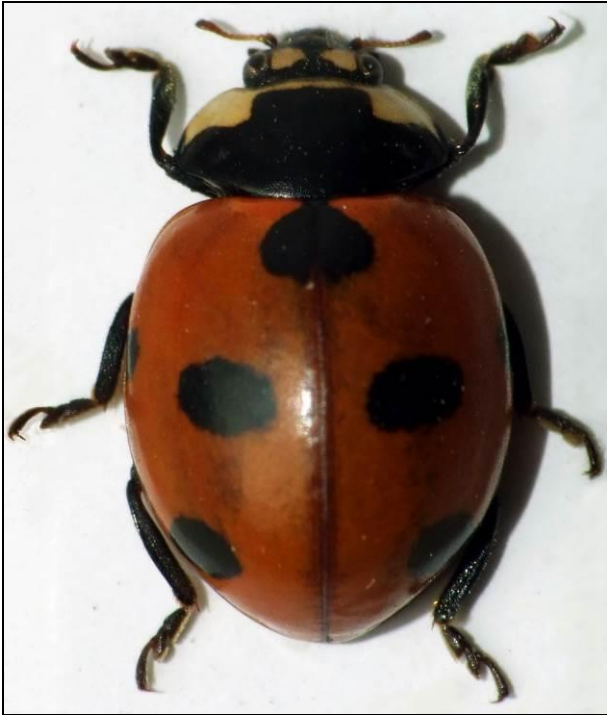
Mâle de Coccinella magnifica récolté le 12 avril 2015 à Saint-Quirin (57)

Trois individus (2 mâles et 1 femelle) sont prélevés afin de confirmer leur identification sous la loupe binoculaire. Je prélève également une dizaine de fourmis qui se révéleront être des Formica polyctena Foerster.